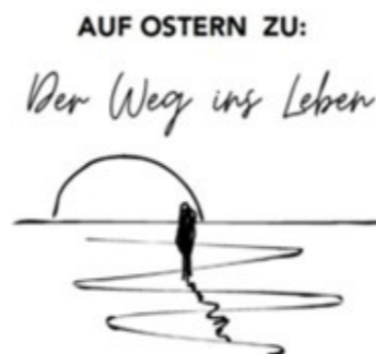
Geistliche Abende in der Fastenzeit