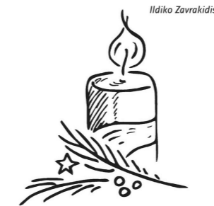
1. Advent: Die Umkehr wagen