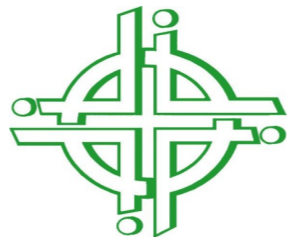
© Weltgebetstag der Frauen – Deutsches Komitee e.V.

Aschermittwoch, 26.02. Aschermittwoch feiern wir in allen drei Gemeinden um 18 h die Heilige Messe mit Aschekreuz.