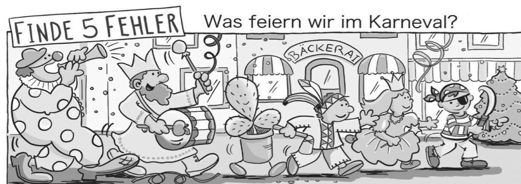
Apfel, Kakthus, Banane, BäckerAI, Weihnachtsbaum

Alle Freitage im des Jahres sind im Gedenken an das Leiden und Sterben des Herrn kirchliche Bußtage, an denen die Gläubigen zu einem Freitagsopfer (Abstinenz von Fleischspeisen oder von einer anderen Speise entsprechend den Vorschriften der Bischofskonferenz; c. 1251 CIC) verpflichtet sind; ausgenommen sind die Freitage, auf die ein Hochfest fällt. Das Freitagsopfer kann verschiedene Formen annehmen: Verzicht auf Fleischspeisen, der nach wie vor sinnvoll und angemessen ist; spürbare Einschränkung im Konsum, besonders bei Genussmitteln; Dienste und Hilfeleistungen für den Nächsten.